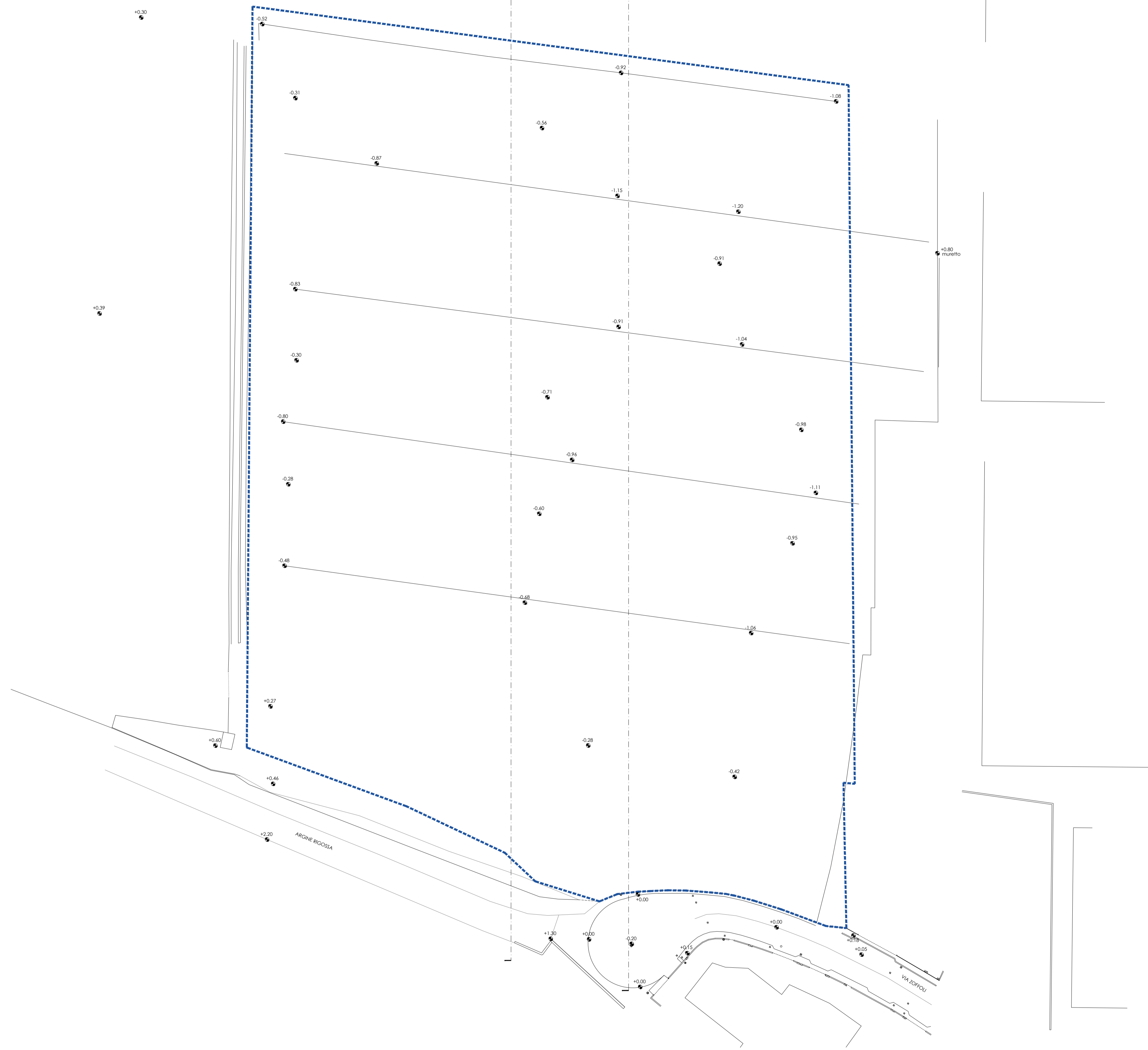
RILIEVO DELLO STATO DI FATTO _ Scala 1:500

COMUNE DI GAMBETTOLA Comune di Gambettola COPIA CONFORME ALL'ORIGINALE DIGITALE 07/2024 DEL 08/09/2024 FIDELTARI: STEFANO ROSSI